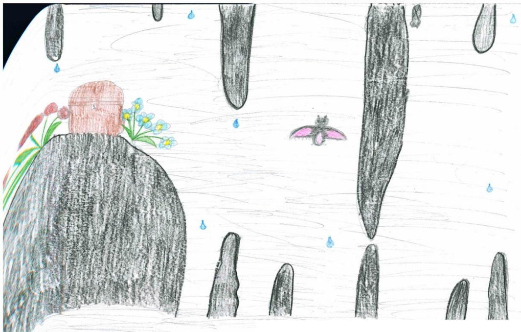
Grétka Bajtošová , 2.A